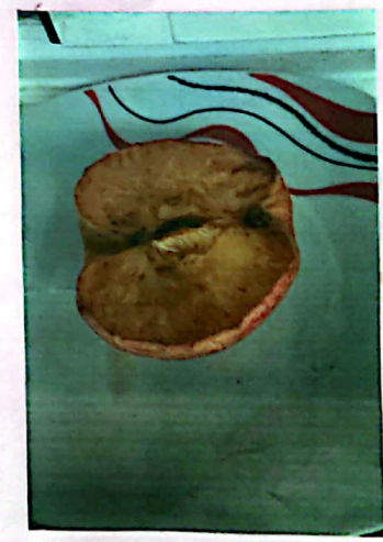
Día 7 - la manzana está empezando a oler muy poco y a ponerse muy floja.