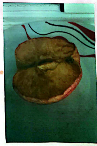
Día 8 - la manzana está mucho más de un punto intermedio de oxidación o descomposición, ya que está empezando a oler malo y está empezando a oler muy fuerte. (está muy oxidada).