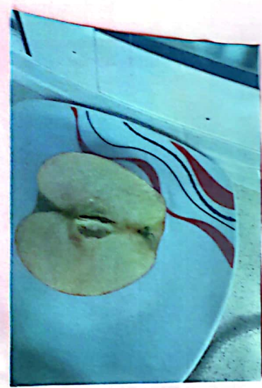
Día 1 - la manzana está recién cortada y puesta así así.